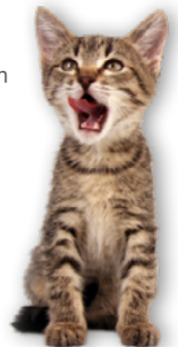
Los gatitos se acostumbran a la comida cruda como los patos al agua.