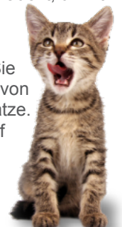
Katzenwelpen sind für Rohfutter so leicht zu begeistern wie Enten fürs Wasser.