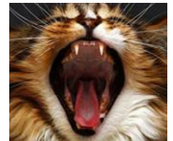
Trockenfutter säubert die Zähne Ihrer Katze nicht.

FelineNutritionFoundation.org © 2015 Feline Nutrition Foundation