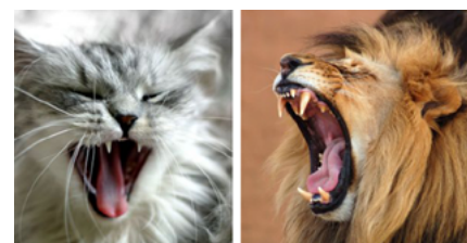
Kleine of grote kat, dit zijn de tanden en kaken van een roofdier.

Kijk eens goed naar het gebit van je kat. Dan zie je kaken en tanden die ontworpen zijn om prooivlees te eten. Lange, scherpe snijtanden om het prooidier te grijpen, te verankeren en te doden. Hun messcherpe tanden aan beide zijden van de kaak gaan door huid, vlees en bot. Katten kauwen namelijk niet op eenzelfde manier zoals plantetende dieren doen. Hun kaken bewegen niet van links naar rechts. Evenmin hebben katten kiezen om hun eten te vermalen. Katten gebruiken hun snijtanden om het vlees in kleine stukjes te snijden om deze vervolgens door te slikken.