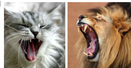
Kleine of grote kat, dit zijn de tanden en kaken van een roofdier.

Kijk eens goed naar het gebit van je kat. Dan zie je kaken en tanden die ontworpen zijn om prooivlees te eten. Lange, scherpe snijtanden om het prooidier te grijpen, te verankeren en te doden. Hun messcherpe tanden aan beide zijden van de kaak gaan door huid, vlees en bot. Katten kauwen namelijk niet op eenzelfde manier zoals plantetende dieren doen. Hun kaken bewegen niet van links naar rechts. Evenmin hebben katten kiezen om hun eten te vermalen. Katten gebruiken hun snijtanden om het vlees in kleine stukjes te snijden om deze vervolgens door te slikken.