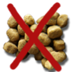
Weg mit dem Trockenfutter.

und schweren Verdauungsstörungen führen. Katzen stillen ihren Energiebedarf hauptsächlich aus Glukose, die in ihrer Leber aus Protein gebildet wird, nicht aus Kohlenhydraten. Katzen haben sich als Wüstenbewohner entwickelt, daher haben sie von Natur aus kaum Durstempfinden. Werden sie mit trockenen Körnchen gefüttert, können sie chronisch austrocknen und haben ein erhöhtes Risiko für Erkrankungen der Harnwege und der Nieren. Trockenfutter hat einen Feuchtigkeitsgehalt von etwa zehn Prozent, und trockenfütterter Katzen erhalten, auch wenn sie Wasser trinken, nur rund die Hälfte der Flüssigkeitsmenge, die sie bei Dosen- oder Rohfutter mit 60 bis 70 Prozent Feuchtigkeitsgehalt aufnehmen.