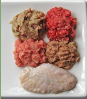
Eine Auswahl von gewolftem Rohfutter und zerkleinerten Stücken samt Knochen.