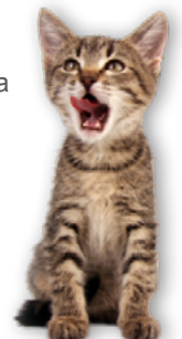
Los gatitos se acostumbran a la comida cruda como los patos al agua.