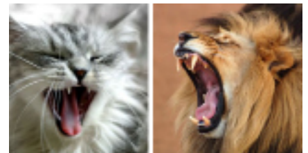
Essas são mandíbulas e dentes de um animal desenvolvido para comer uma dieta baseada em presas.